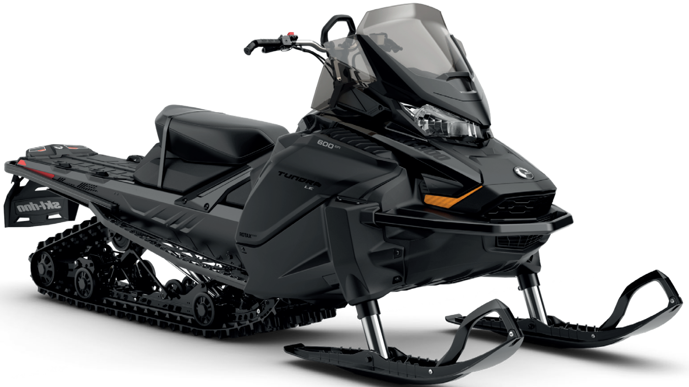
TUNDRA LE 600 EFI KUVASSA